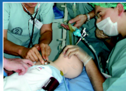
Simulatorraum: Bronchoskopie am Full-Scale-Baby-Simulator