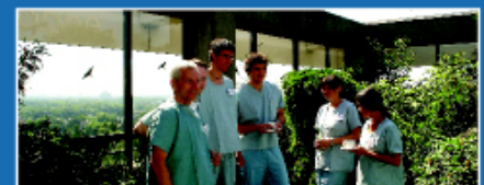
Exklusives Ambiente über Köln