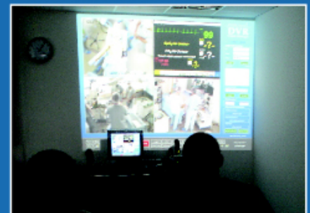
Beobachtungsraum mit Live-Übertragung