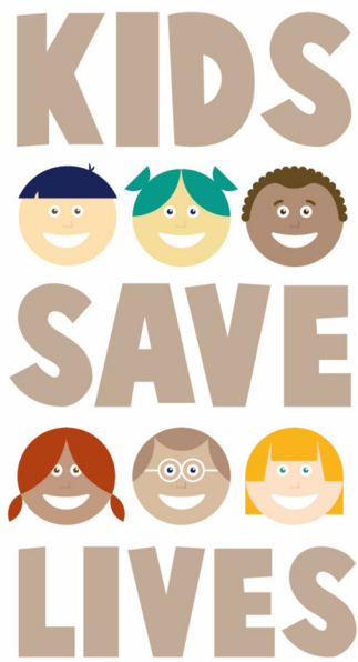
Abb. 2 ▲ Die internationale „KIDS SAVE LIVES“-Initiative wird durch dieses Logo repräsentiert, das vom Italienischen Rat für Wiederbelebung/Italian Resuscitation Council (IRC) erstellt wurde. Das IRC erlaubt ausdrücklich die kostenlose und möglichst breite Verwendung und Verbreitung dieses Logos für alle „KIDS SAVE LIVES“-Initiativen, Aktivitäten und Kampagnen weltweit